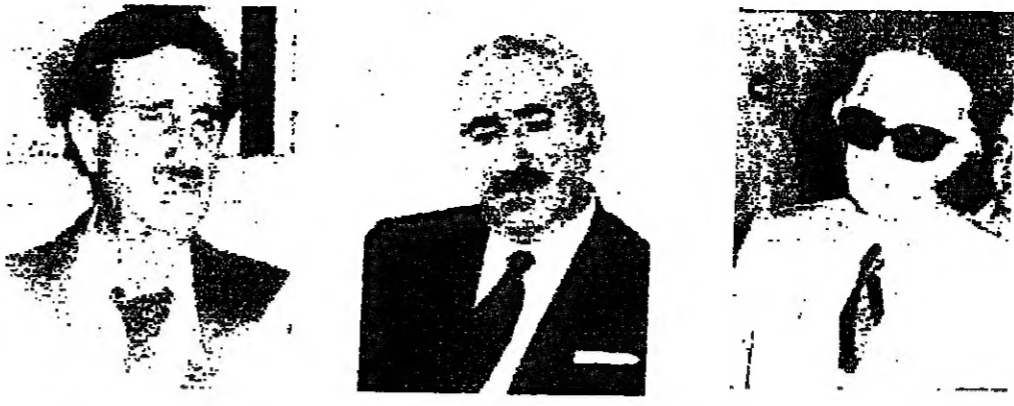
الرئيس كميل شمعون ، الرئيس رشيد كرامي ، السيد كمال جنبلاط

تواجه هيئة الحوار الوطني قسلا اجتماعها هذا الاثنين في ديرسان رئيس الحكومة في السراي مشككين بتعداد مبعوثيها الأولى هي مشكلة ضم أعضاء جدد إليها ، والثانية هي الخلاف الحاد بين أعضائها .